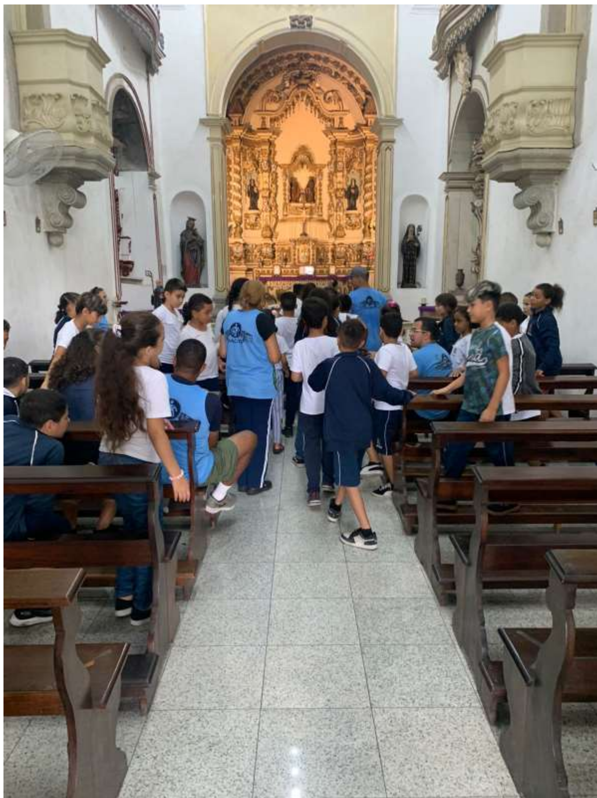
Foto: reunião na capela, para começar a monitoria.