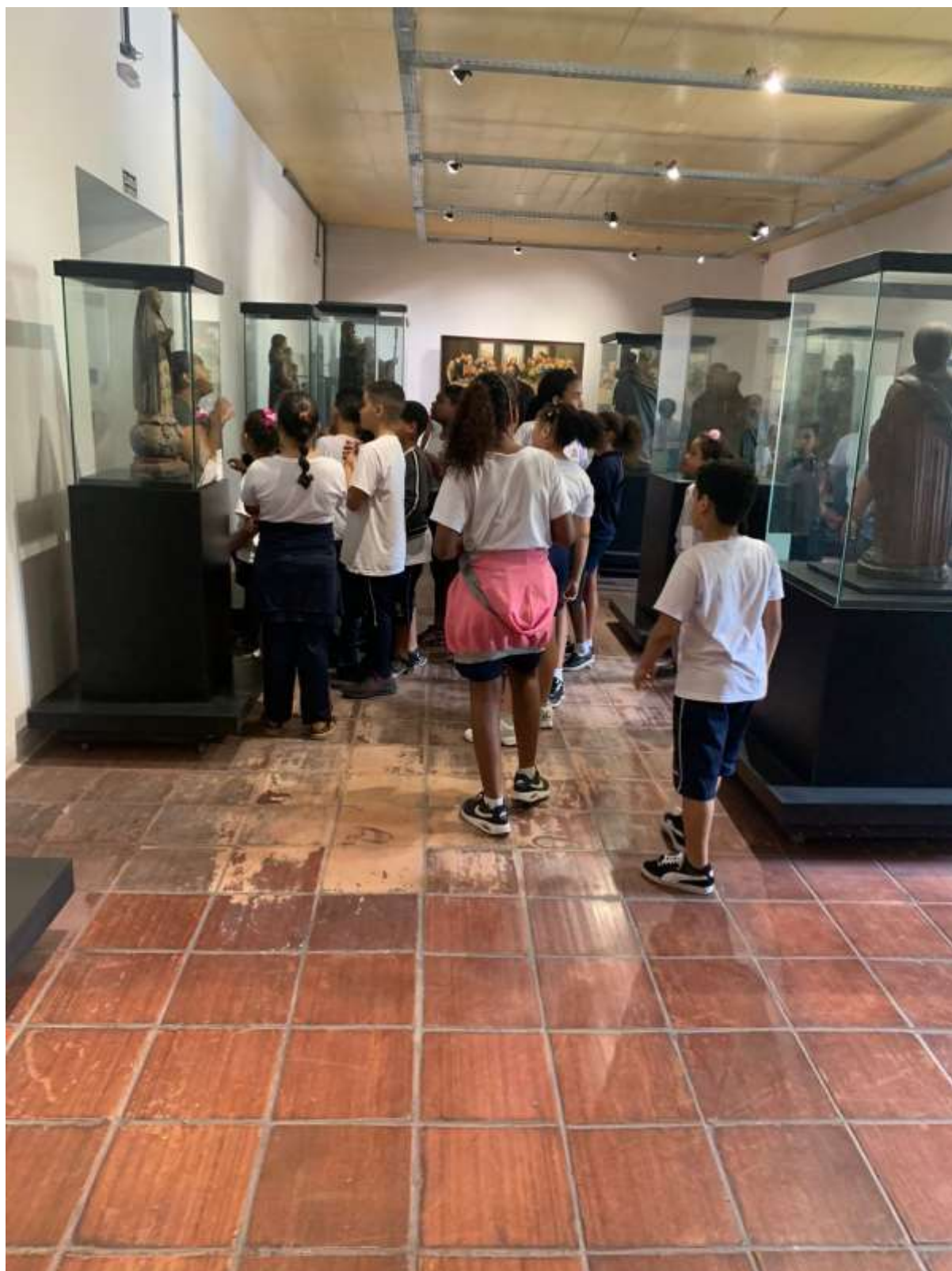
Foto: crianças aprendendo sobre as imagens