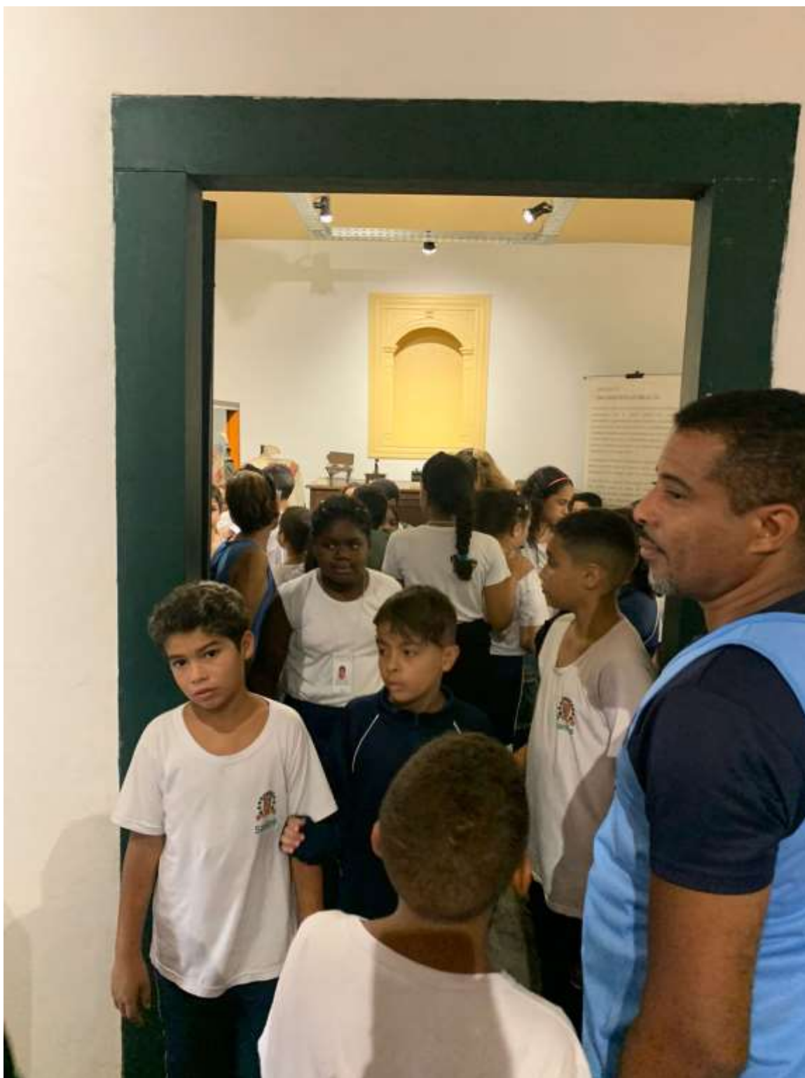
Foto: visita a sacristia.