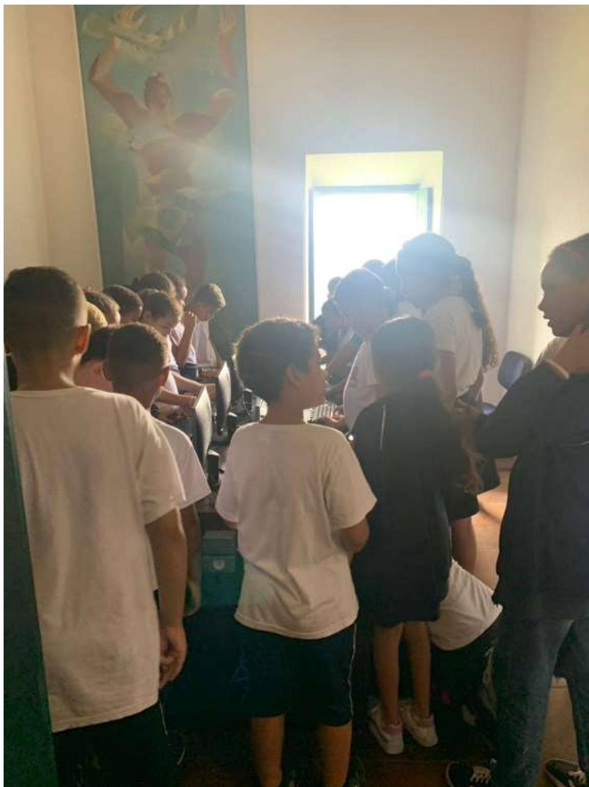
Foto: visita a sala de informática