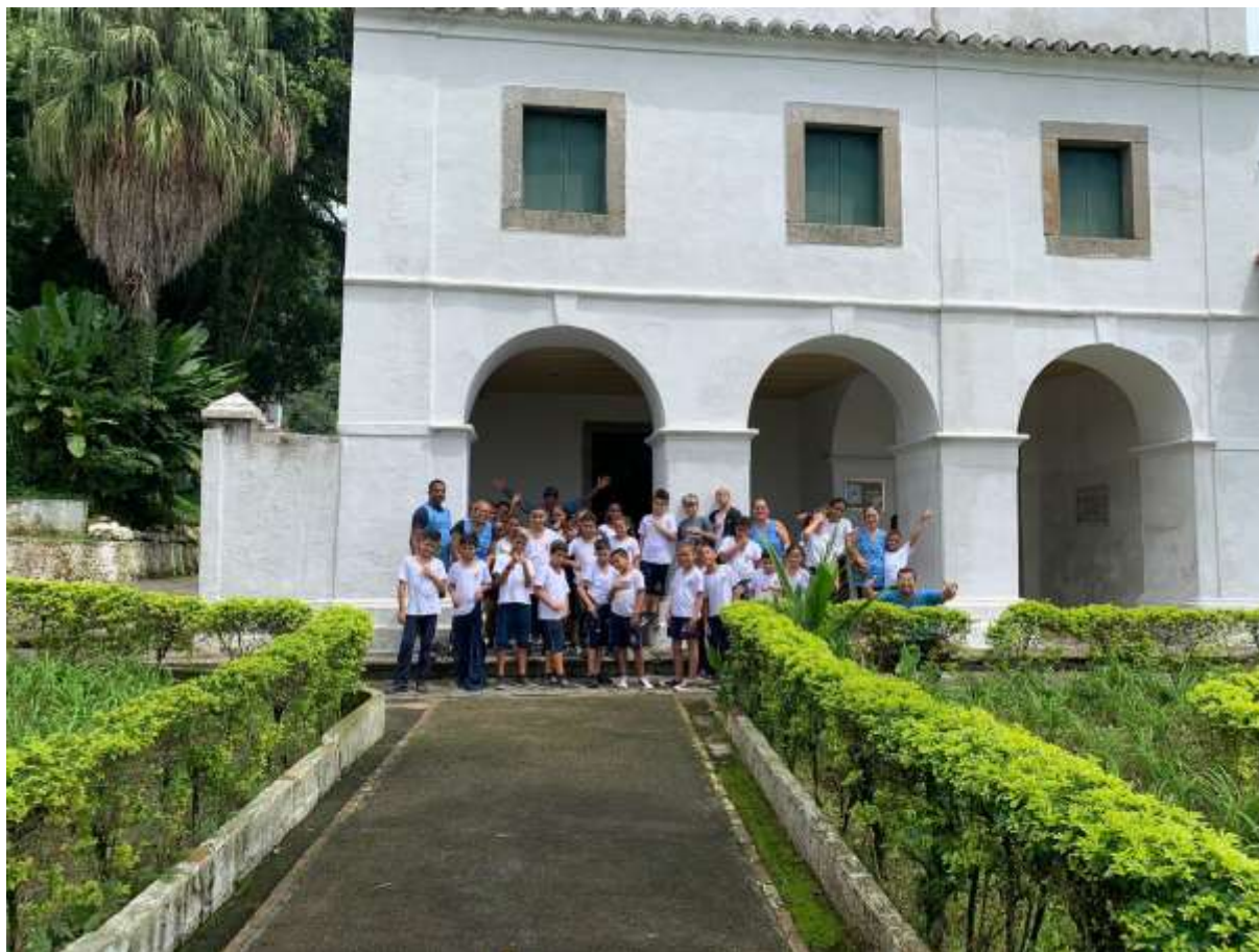
Foto: turma reunida na frente do museu.