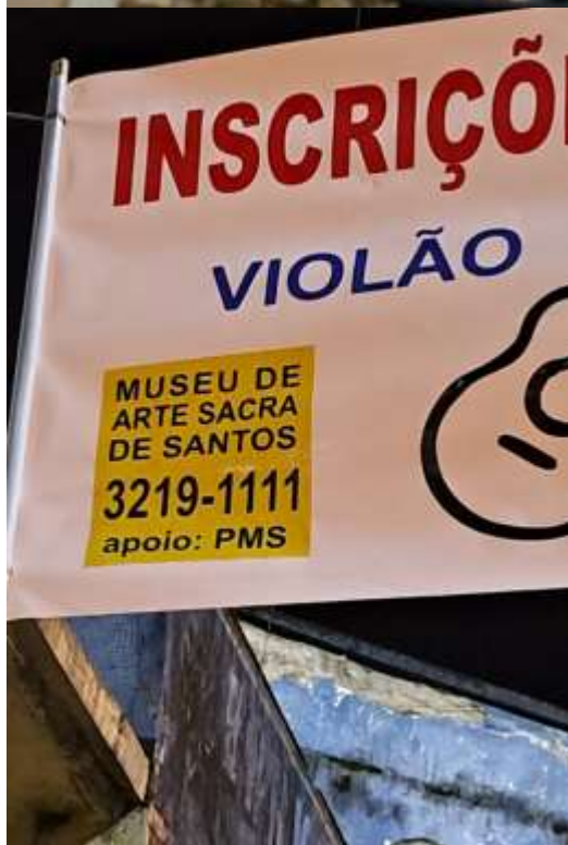
Divulgação por faixa nas entradas para a Comunidade do Morro São Bento