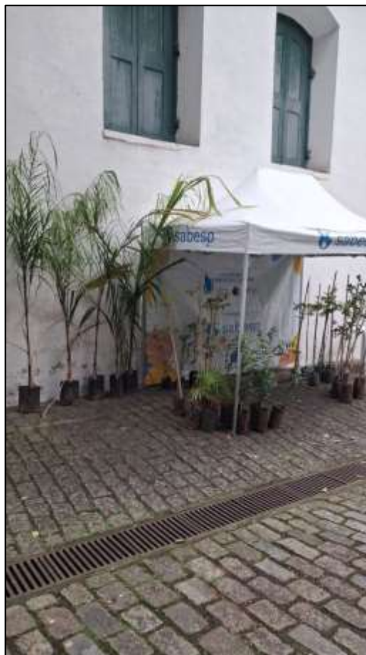
Foto 1: Os alunos das unidades escolares junto com os responsáveis pelo plantio de novas mudas pelo museu.

Fotos 2: Tenda montada para abrigar as mudas das árvores que foram plantadas pelo museu.