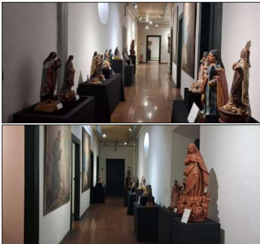
Fotos: Corredor onde está localizado a exposição SANTOS DE BARRO por Felipe Callipo

No dia 20/09, as 10h da manhã ocorreu a inauguração da nova exposição temporária do MASS, produzida pelo artista Felipe Callipo, a exposição conta com cerca de 20 imagens de diversos santos da Igreja Católica Apostólica Romana, todas elas produzidas em terracota.