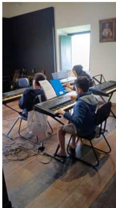
Foto 1: Lista de presença dos alunos do mês de setembro. Fotos 2: Foto de uma das aulas que ocorreram durante o mês de setembro.

As aulas de teclado e violão ocorrem aos sábados, sendo que: